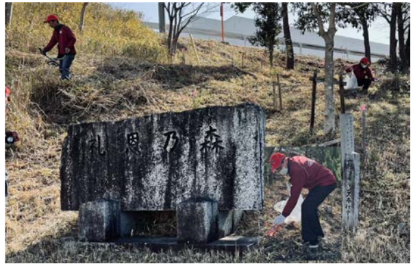
岡崎フォレスト LC プロウォーキング