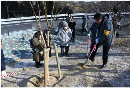
土が凍っており苦戦する会長