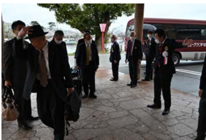
会津若松鶴城 LC を出迎え