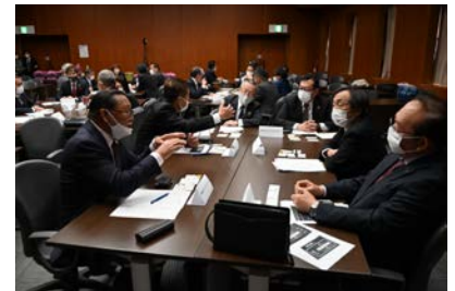
各クラブの会長幹事委員による情報交換