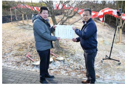
市から感謝状を頂きました