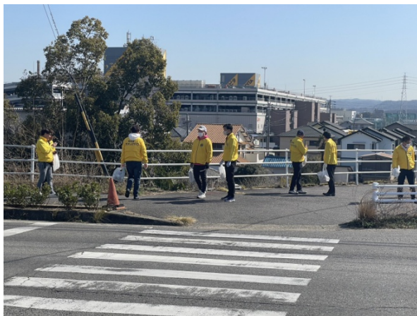
岡崎南 LC のプロウォーキング