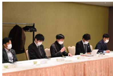
各クラブの委員による報告