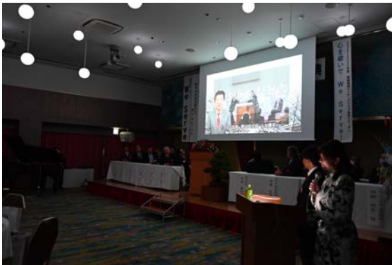
映像で見せる 45周年から 50周年までの活動

スポンサークラブとは、クラブ結成の際に後見人となり正しくライオンズクラブと成れる様にサポートするライオンズクラブで、岡崎竜城 LC は岡崎葵 LC がそれに当たります。式典では 50 周年まで支えてくれた岡崎葵 LC へ感謝状を贈りました。