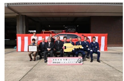
メンバー、消防署の方と記念撮影