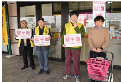
パネルを掲げて呼び込み