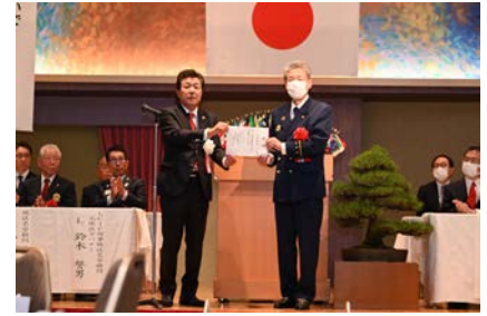
岡崎市消防本部へ車両の目録贈呈