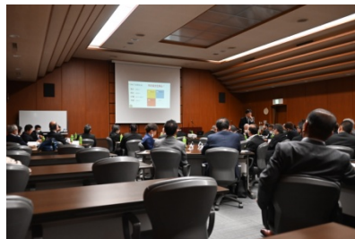
パワーポイントを使用し解説