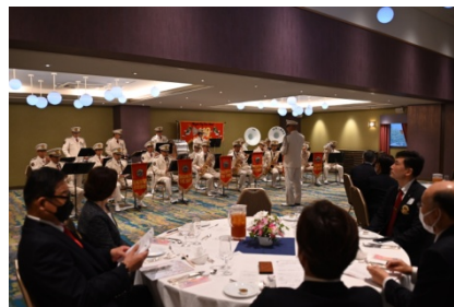
岡崎市消防本部による祝宴コンサート