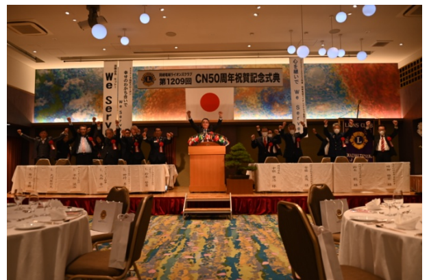
ZC L. 大河原によるライオンズ・ローア

式典を終えて、岡崎竜城ライオンズクラブは次の 50 年の 100 周年に向けて動き出しました。