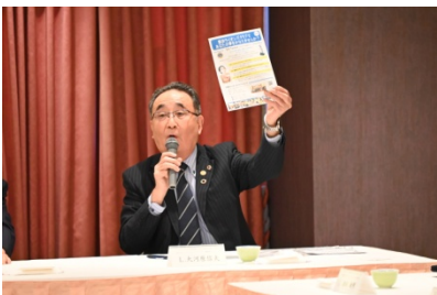
委員会での ZC L.大河原