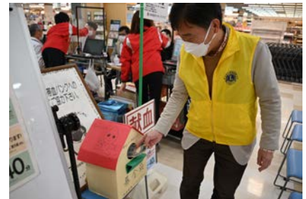
さい帯血バンクへ募金