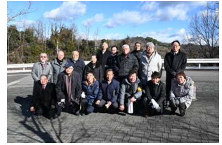
岡崎では希少な積雪の中の植樹でした