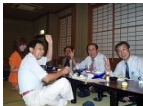
談笑するメンバー