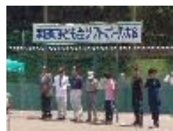
表彰式のメンバー

7月30日(日) 幸田町「とぼねグラウンド」で「幸田町子ども会ソフトボール大会」が開催。幸田ライオンズクラブは優勝、2位、3位、4位チームにメダル(金、銀、銅)を授与した。