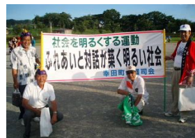
パレード参加のメンバー達