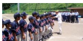
会長によるメダルの贈呈