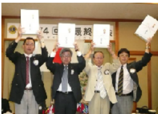
会長感謝賞の皆さん