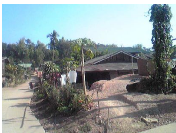
ドイラン村の街並み