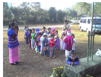
ドイラン村の子供達