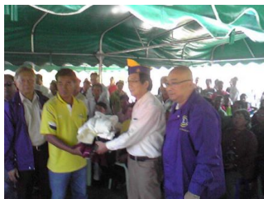
昨年のチェンライLCへの古着贈呈の様子