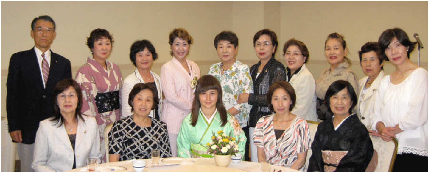
振袖が似合うおとなしいが、頭の良いお嬢さんでした。