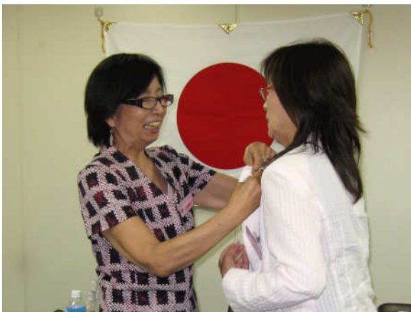
前会長から新会長へバッジの譲渡