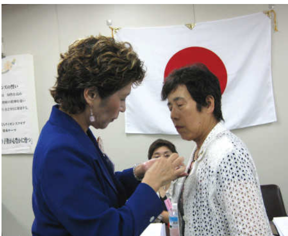
前会計から新会計へ