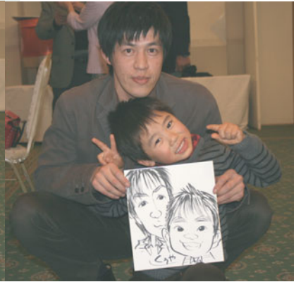
Ｌ市川の次男さんとお孫さん