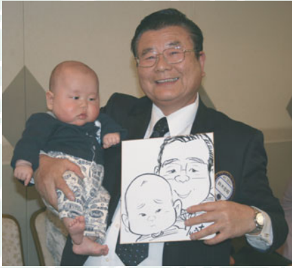
鈴木会長とお孫さん