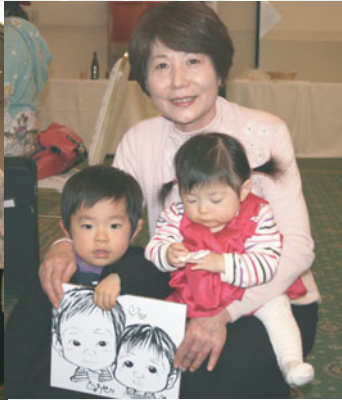
Ｌおおむらファミリー