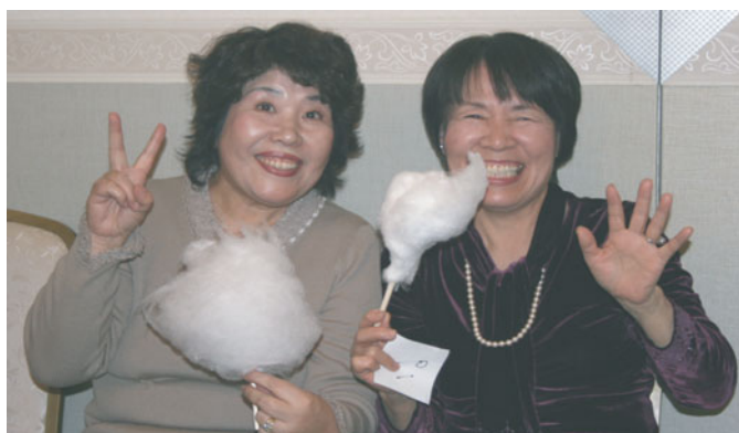
今年は例年以上に綿菓子人気で行列もできました。