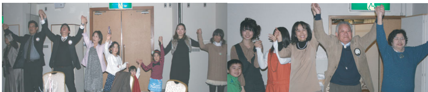
最後はみんなで「また会う日まで」また来年宜しく