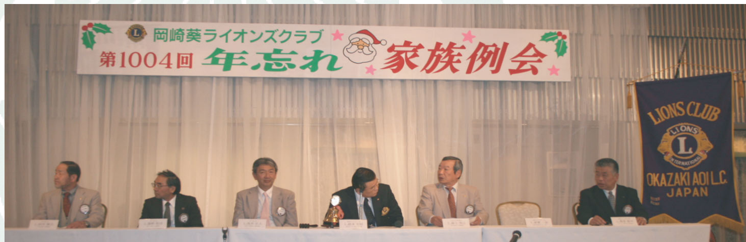
今年も楽しく家族例会を行うことができました。