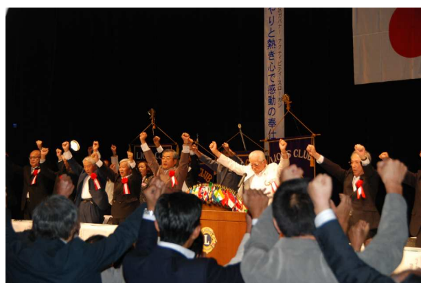
最後は8クラブ全員の力強いローアでした。