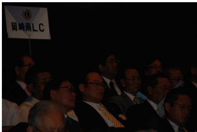
岡崎南L.Cも大勢出席しました。