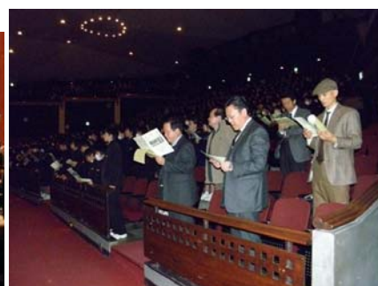
（クラブ委員も参加）