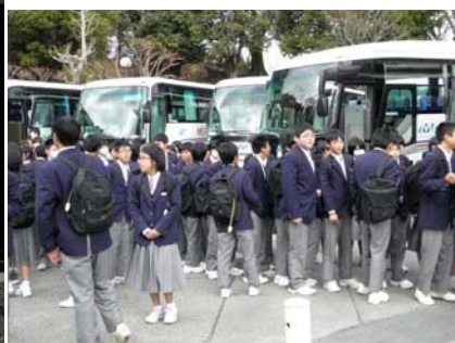
（バス単位にて会場に）