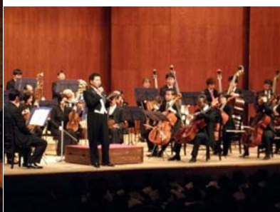
（聴きほれる生徒たち）