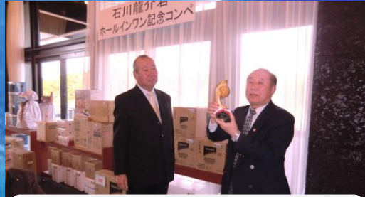
ホールインワン記念トロフィー贈呈