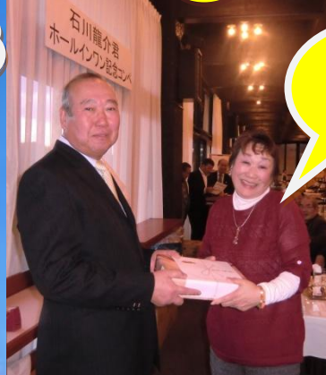
L. 清竹 すばらしい 笑顔