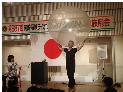
見事な芸を披露してくれました。