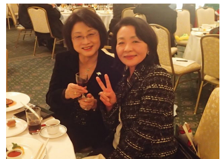
竜城のきれいどころのお二人です。