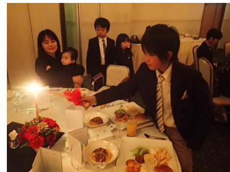
キャンドルサービス