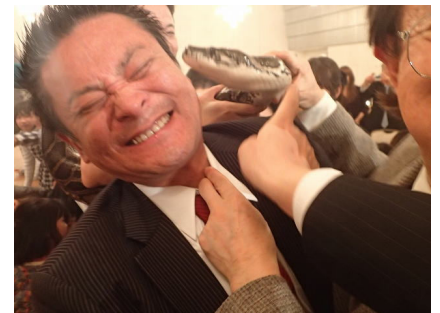
悪乗りする大人達