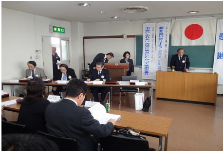
新会場での初めての例会です。