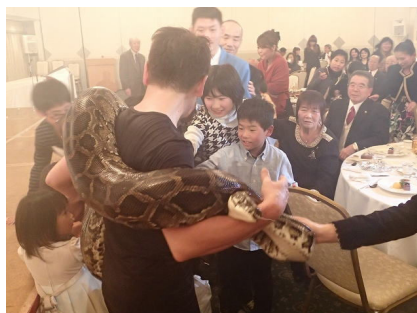
アナコンダに興奮する子供達